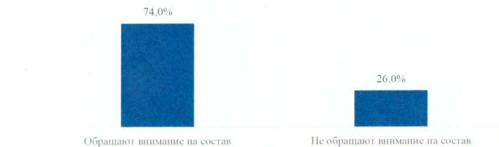
Диаграмма 3. Внимание респондентов к составу сыра «Адыгейского»

По мнению 91,2% респондентов сыр «Адыгейский» может производиться любым производителем в полном соответствии с нормами и требованиями к данному сыру. А 8,8% опрошенных считают, что сыр «Адыгейский» может производиться только на территории республики Адыгея.