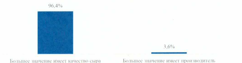
Диаграмма 2. Значимость качество сыра и его производителя

Обращают внимание на состав продукта 74,0% респондентов. Не обращают внимание на состав – 26,0%.